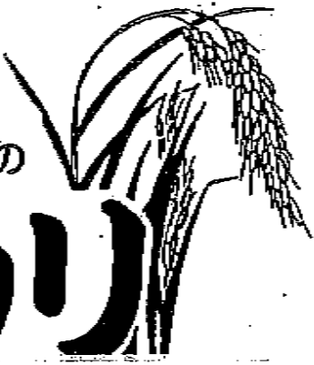
平成28年小国産コシヒカリ価格表(税、送込み)